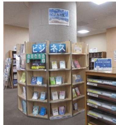
2階 ビジネス展示コーナー