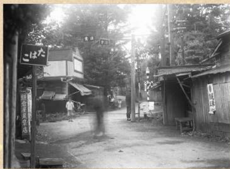
京成葛飾駅東側踏切 昭和10(1935)年