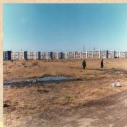
若松団地 昭和41(1966)年