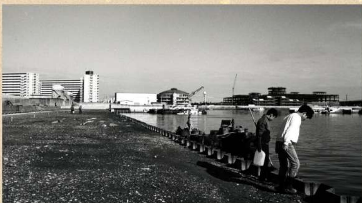
らぽーと建設中 昭和55(1980)年

令和8年6月13日(土)から7月26日(日)まで 開館時間 9:30~20:00(土・日・祝~17:00) 休館日 6月29日 会場 船橋市西図書館 2階 ギャラリー