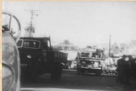
市制施行20周年記念映画『躍進する船橋』より 昭和32(1957)年