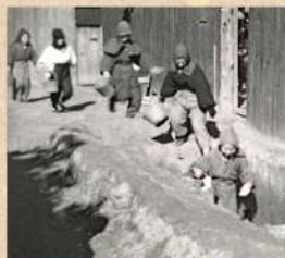
防空避難訓練 昭和18(1943)年