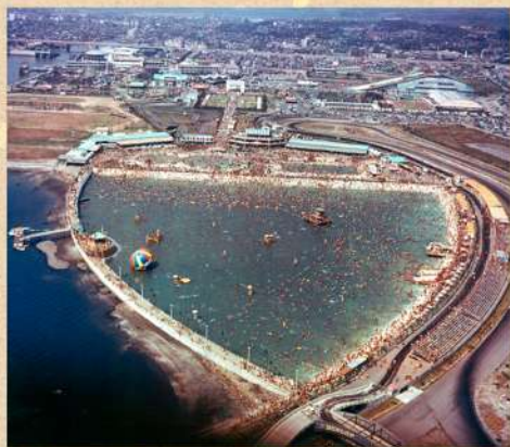
船橋ヘルスセンターゴールデンビーチ 昭和43(1968)年