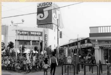
高根木戸駅前 昭和61(1986)年